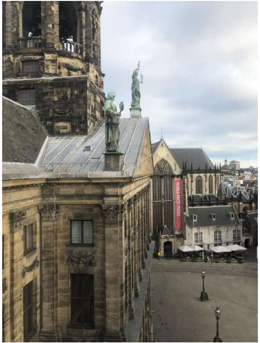
Het Koninklijk Paleis op de Dam

Dat neemt niet weg dat ik me graag op allerlei manieren voor jullie club wil inzetten.