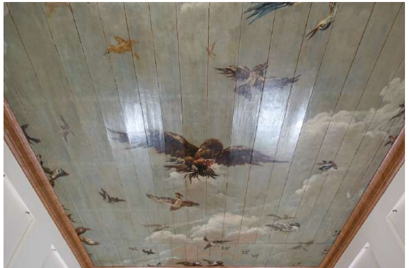
Gerestaureerd 17e-eeuws plafond.

In dit huis kwam ik het eerst bijzonder 17e-eeuws stucwerk tegen: zeer glas, als gepolijst werk dat een warme uitstraling heeft als van marmer. Een marmertekening leek het echter niet te hebben.