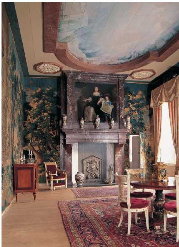
Ridderhofstad Gunterstein, Breukelen. De Gobelinzaal.