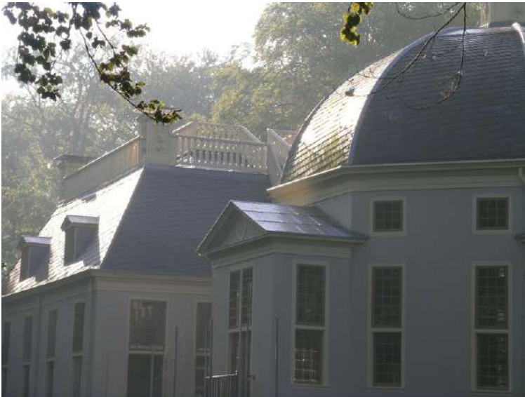
Trompenburgh, 's-Graveland tijdens de restauratie.

Door dit werk heb ik vanaf 2000 de restauratie van het huis Trompenburgh in 's-Graveland mogen begeleiden. Een bijzonder huis dat ook na de inval van de Fransen herbouwd moest worden. De architect is niet bekend, maar de bijzondere koepelzaal heeft mensen doen vermoeden dat het een grote naam uit de 17e eeuw is. Het is een Top 100-monument dat uitzonderlijk goed bewaard is. En dan gaat het om de structuur en de bijzondere hybride wandopbouw van de buitengevels, maar meer nog om de interieurafwerking. Er zijn authentieke vloeren, een oude keuken, beschilderde lambriseringen en heel veel beschilderde plafonds.